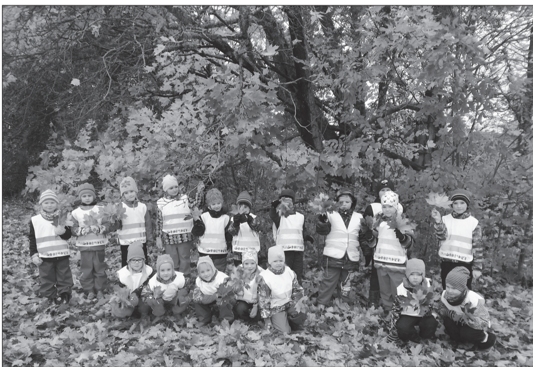
Krõlli lasteaia koolieelikud sügisvärve otsimas

Järgmiseks ettevõtmiseks oli 20. septembril väljasõit Võrtsjärve äärde Järvemuuseumi. Eelpoolnimetatud õppekäik sai teoks tänu Kiki projekti „Õpin toas ja õpin õues“ rahastusele. Seekord oli elevus nakanatanud ka täiskasvanuid, see oli uus koht ka meie jaoks. Kohale jõudes jaotati meid gruppidesse ning õpetajate juhendamisel läbisime erinevaid töötoad (täpsusvise, kalapuzze kokkupanek, kalapüük, erinevate kalaliikide võrdlemine). Järgmine ülesanne anti kogu rühmale, nimelt tuli aidata angerjas Võrtsjärvest Sargasso merre. See oli päris keerukas ja ilma täiskasvanu abita ei tahtnud sugugi õnnestuda. Seejärel saime näidata oma käelisi oskusi kalapildi meisterdamisel. Kõige huvitavam osa ootas meid alles ees. Meile tutvustati väljapanekut erinevatest Eesti kaladest. Kõige uhkema mulje jätsid klaaspõranda all väärikalt ujuvad sägad. Nii mõnegi müüdi „köva“ poisid jaoks oli sellele klaaspõrandale as-