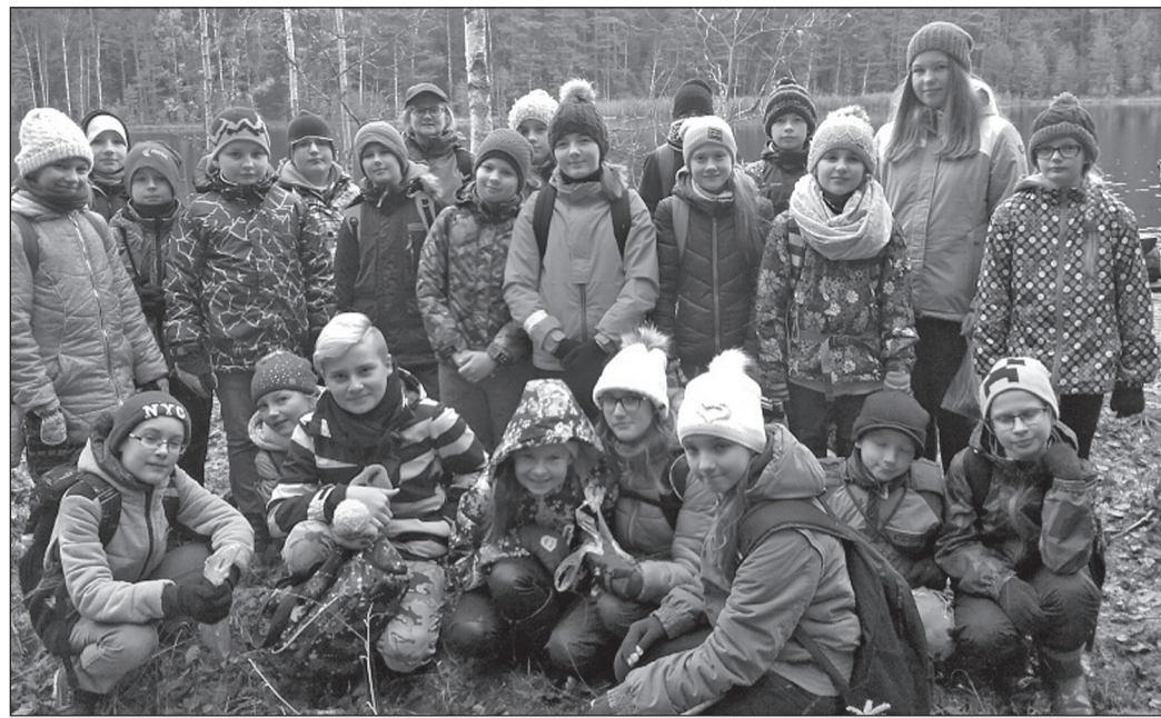
Laste loodusakadeemias osalejad käisid madalsoos sootaimedega tutvumas.