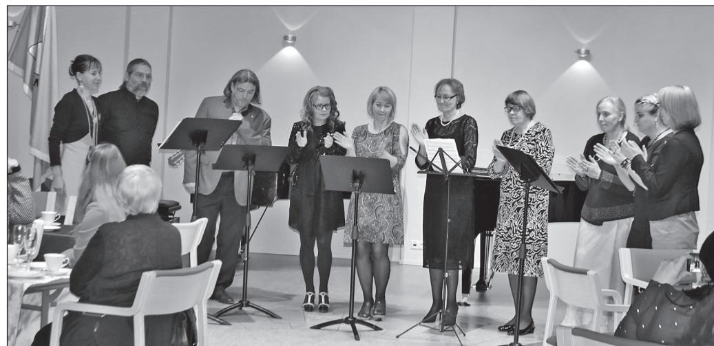
Esineb õpetajate ansambel.