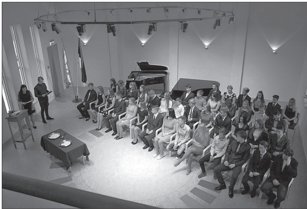
Märgiaktus Nõo Muusikakooli saalis