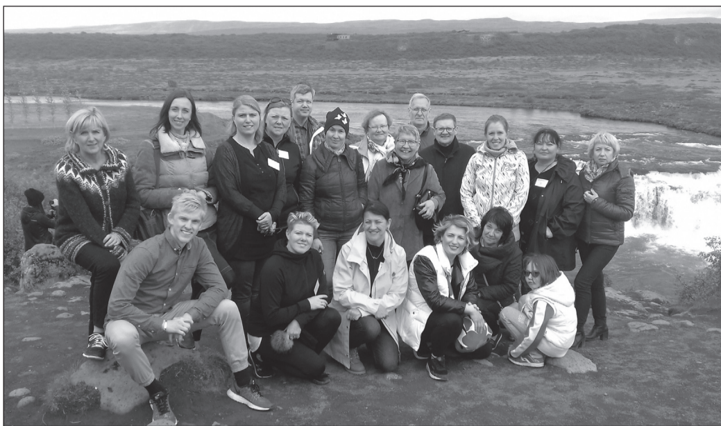
Rahvusvahelises NordPlus Junior koostööprojekti „Viva la Musica!“ osalevad lasteaiaõpetajad Soomest, Lätist, Leedust ja Eestist õppereisil Islandil

Kohtumisel õppisime teiste maade muusikalisi mängu teemal „Muusika ja loodus“ ning pidime ise viis tegevust teistele osalejatele selgeks õpetama. „Duo Stemma“, abielupaar