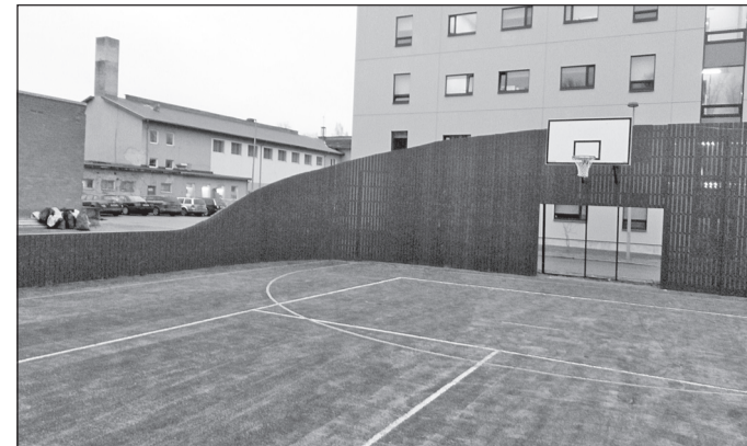
Vastvalminud universaalne mänguväljak Nõo kooli juures.