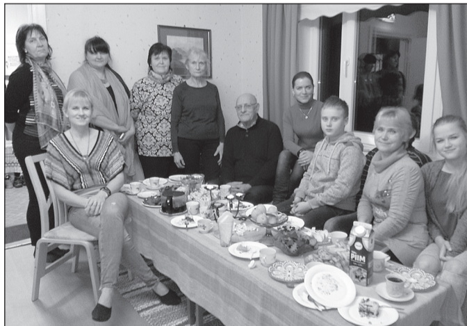
2. detsembril oli Nõo Päevakeskuses õdus jõlumeeleoluline kokkusaamine Aiamaa küla elanikele. Kohale tulid aktiivsemad Pärdi, Karujärve, Aava, Tooma, Matsjaago ja Kirtsi talust. Maiustati piparkookidega, räägiti ühistest ettevõtmistest ja kuulati Nõo Koduloomuuseumi juhataja Kai Toome ettekannet küla ajaloost.