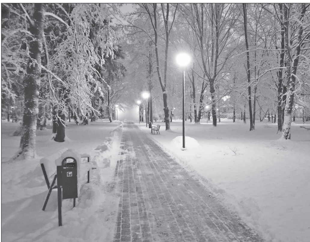
Tuledes särav Nõo park 6. detsembri hommikul.

Pargivalgustuse rajamine on üheks osaks viimastel aastatel teostatud Nõo pargi korrastamisest. Varam on hooldatud puid, rajatud kõnniteed ja paigaldatud pargiinventar. Suuremad pargi korrastamise tööd lõpevad järgmise aasta suve alguses, kui teostatakse viimane osa suuremast puude hooldusest ja raieist ning korrastatakse murupinnad.