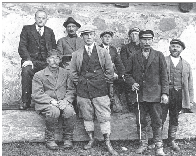
Aiamaa küla peremehed 1928. aastal.