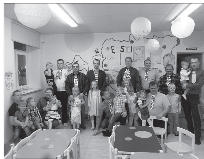
Isadepäevapidu Luke lasteaias Segasumma