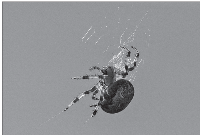
Ämblike kuningas. Vanuseklass 12 kuni 16 eluaastat. Internetihääletus, 1 koht.