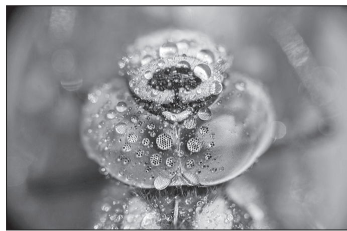
Kiili silmad. Foto Merle Juhanson, vanuseklass üle 17. eluaasta, peaaühind.