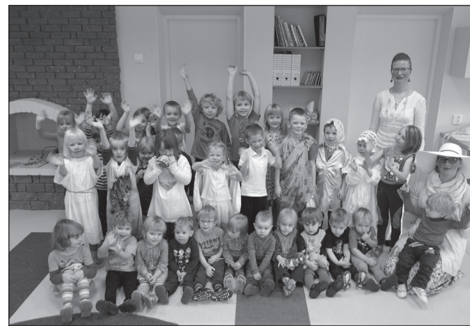
Kadrisandid koos tõrukestega.