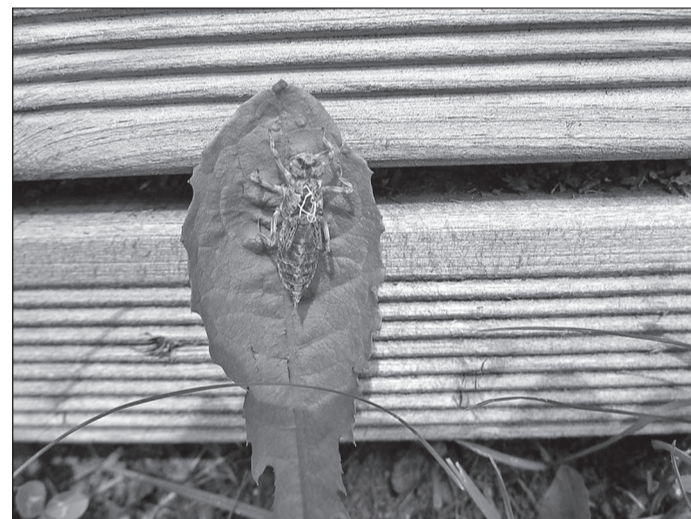
Kiili kest. vanuseklass kuni 11 eluaastat, žürii esile-tõstmine, eluloo märkamise eripreemia.